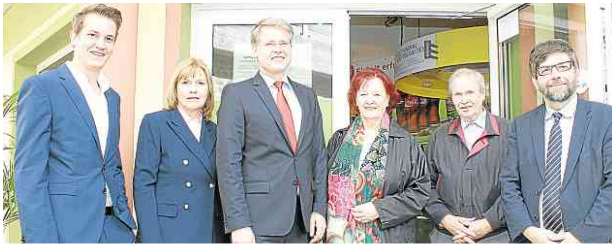
Spende übergeben: Einmal mehr dient der Erlös von Kino VINO in Cochem sozialen Zwecken.

■ Region. „Starke Mädchen, starke Jungen – Geschlechterbewusste Jugendarbeit“ ist am Freitag, 17. Juni, von 18 bis 21 Uhr das Thema einer Schulung des Dekanats Wittlich und der FachstellePlus für Kinder- und Jugendpastoral Marienburg und Wittlich im Jugendraum Alftal in Kinderbeuern. Zielgruppe sind Gruppenleitungen, die auf Freizeiten betreute oder Jugendarbeit begleiten. Anmeldung nur noch heute, 11. Juni. per E-Mail an armin.surkus-anzenhofer@bistum-trier.de