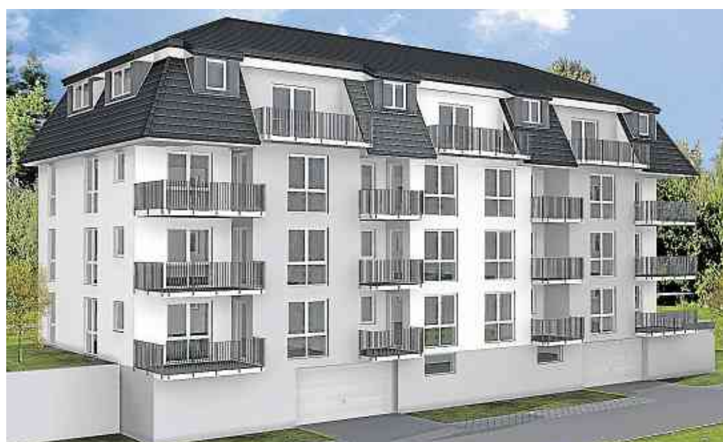
Die Computeranimation zeigt es: Alle Wohneinheiten der neuen Stadtvilla verfügen über mosel-seitige Balkone, die einen grandiosen Blick über Reichsburg und Flusslandschaft garantieren.