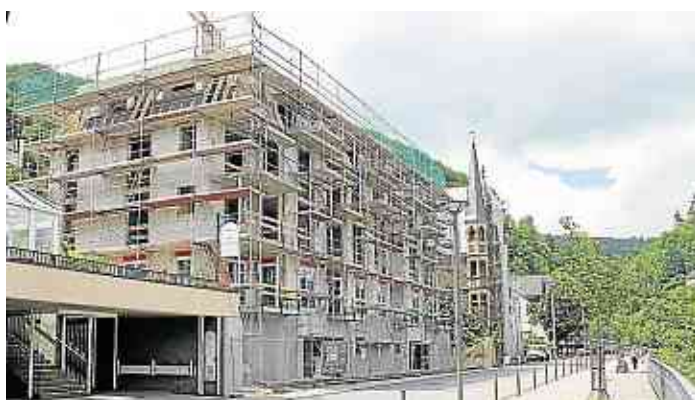
Schnell hat der Neubau der Stadtvilla am Moselufer Form angenommen. Im kommenden Frühjahr sind alle 15 Wohnungen bezugsfertig.